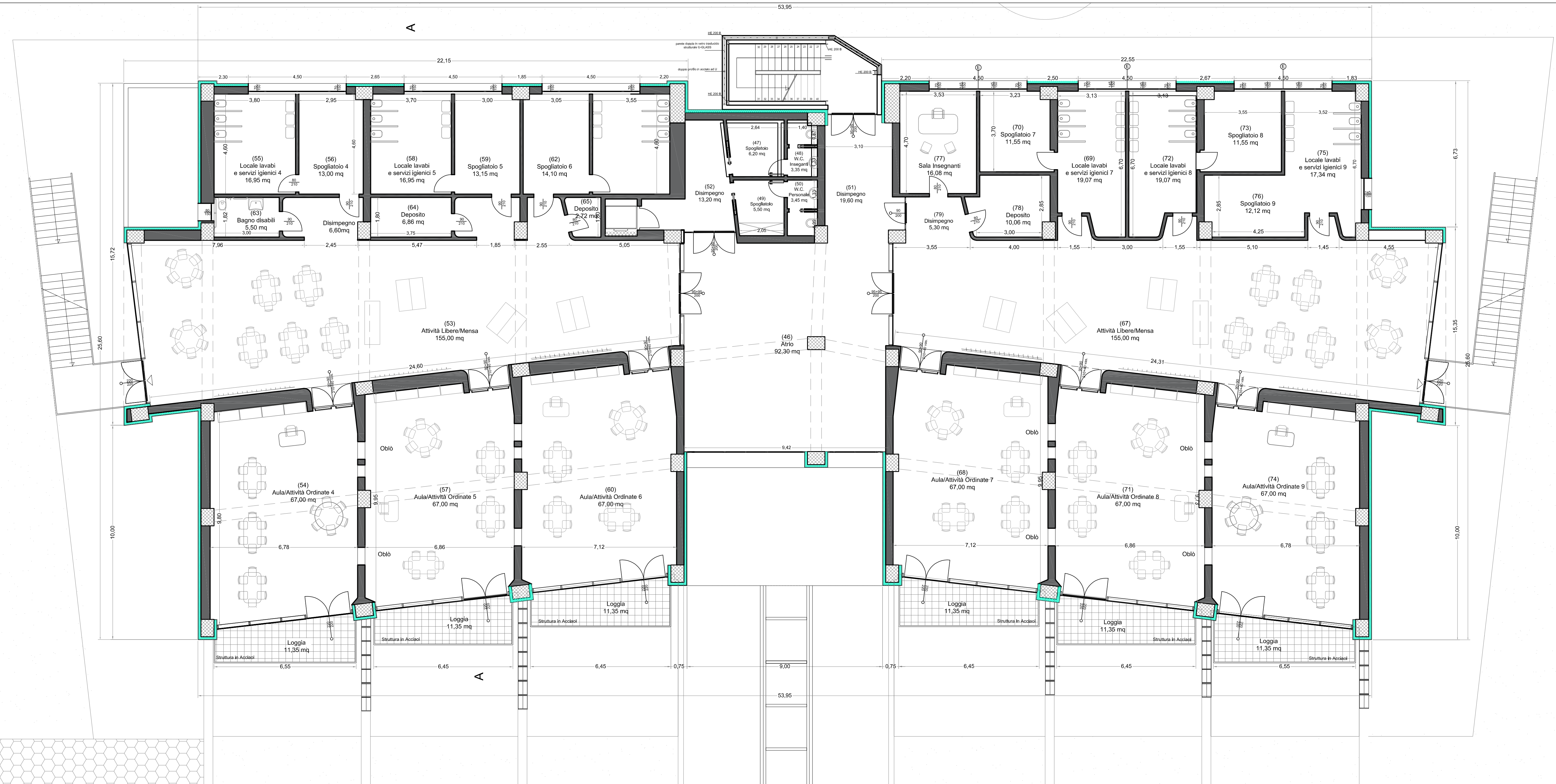
PIANTA PIANO PRIMO scala 1/100