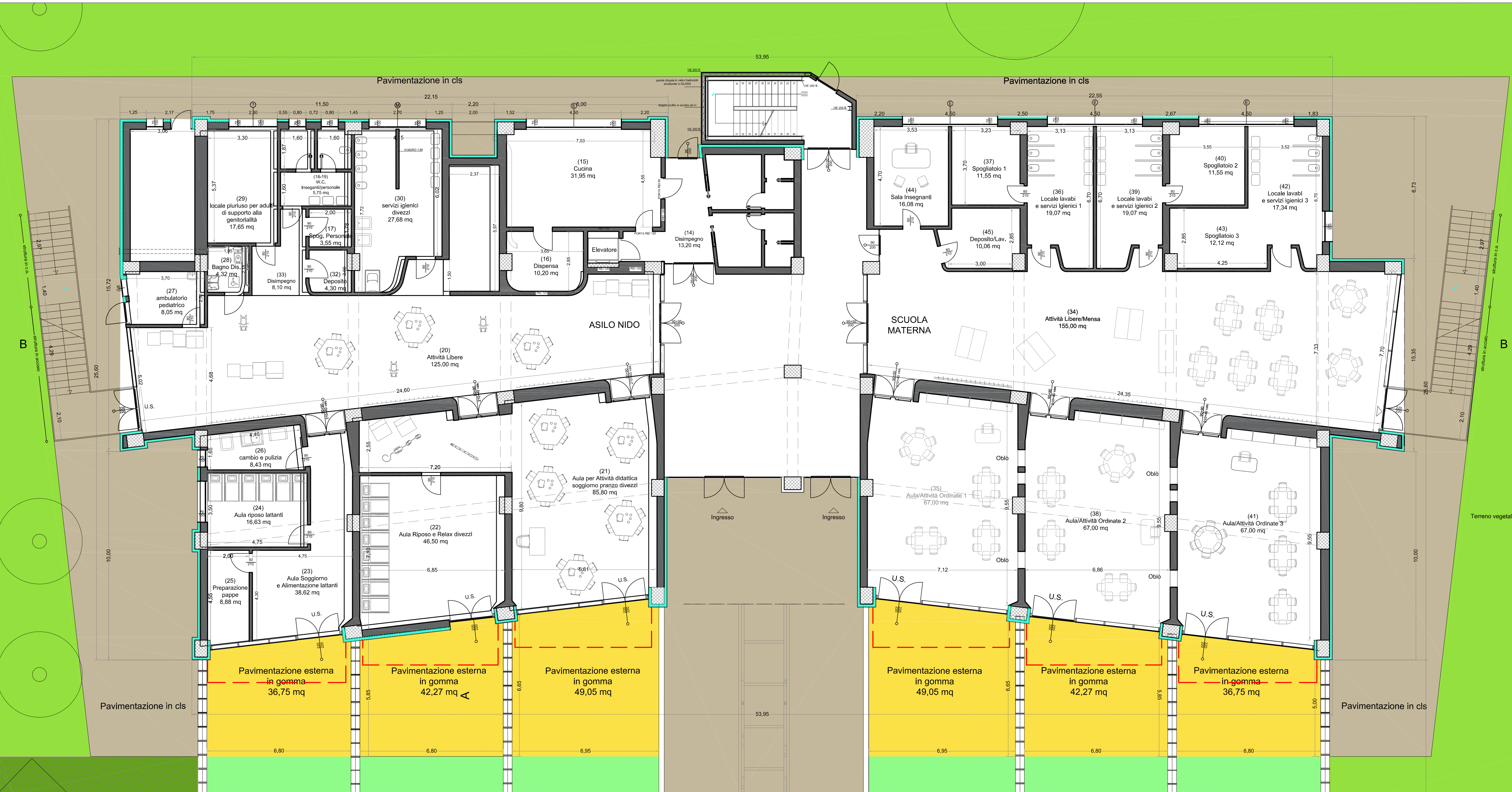
PIANTA PIANO TERRA scala 1/100